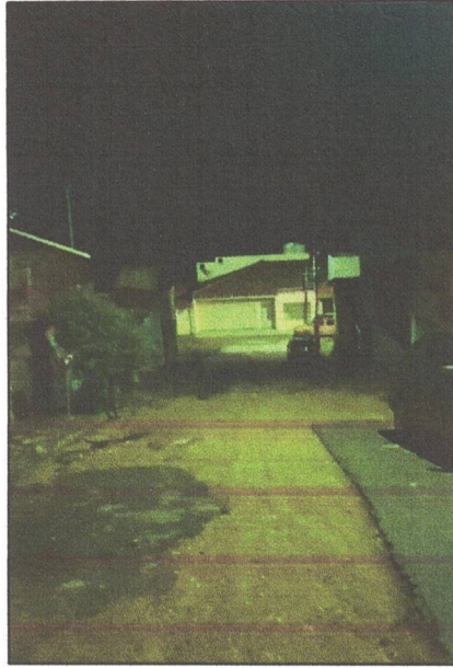
Foto 1 – Trecho com buracos na via – Rua João Gonçalves Moraes – bairro Nossa Senhora Aparecida